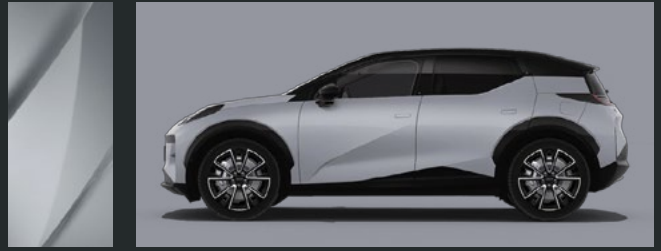
Grey Mist | C35