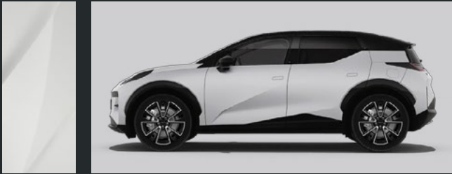
Crystal White | 707