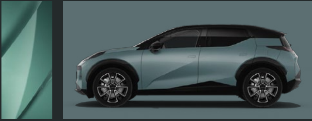
Green Pine | G01